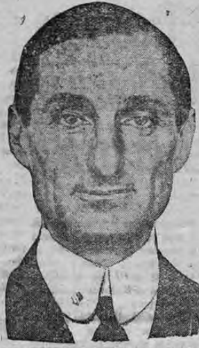
MR. WILLIAM GIBBS MAC ADOO.